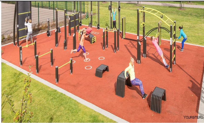
Sports Workout Complex