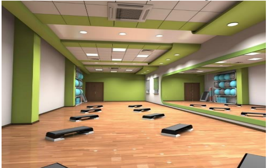
Modernized Room 305 for Wellness Activities