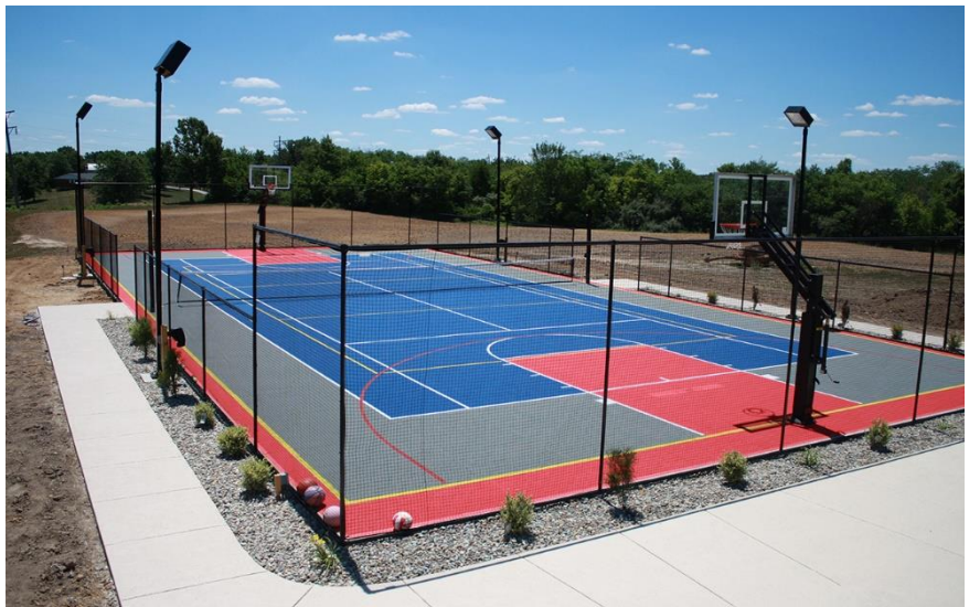
Многопрофильная площадка для игры в волейбол, баскетбол