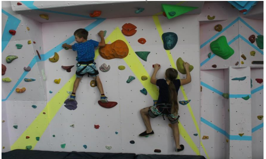
Modernized Room 224 for Rock Climbing