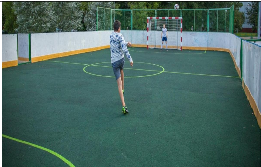
Многопрофильная площадка для игры в мини-футбол, гандбол