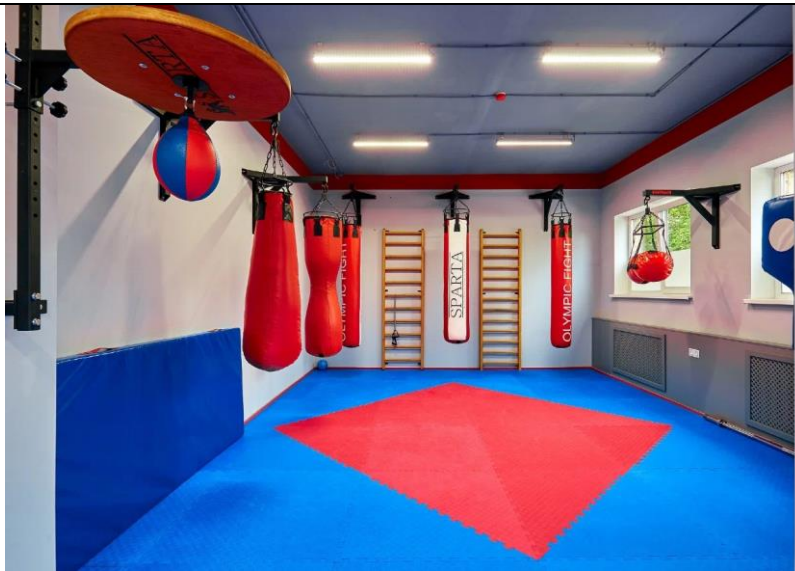
Modernized Room 306 for Martial Arts