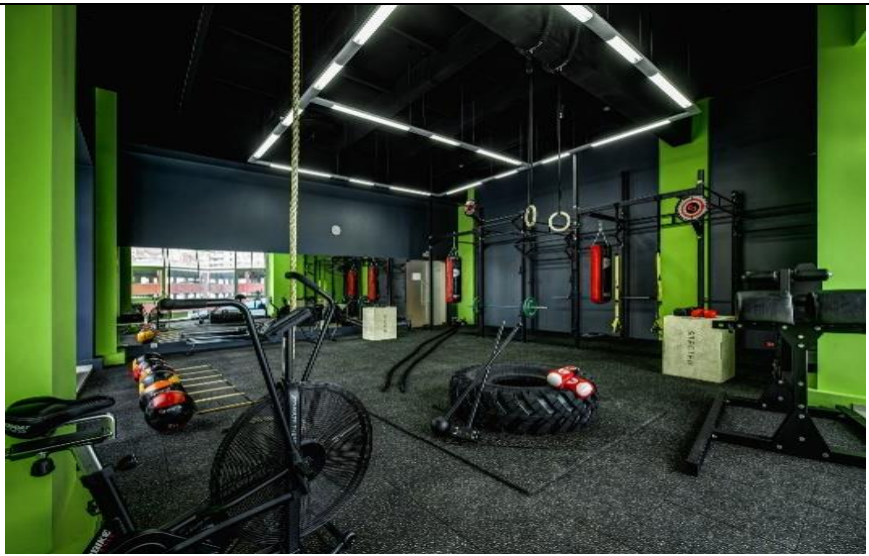
Modernized Room 311 for Strength Training