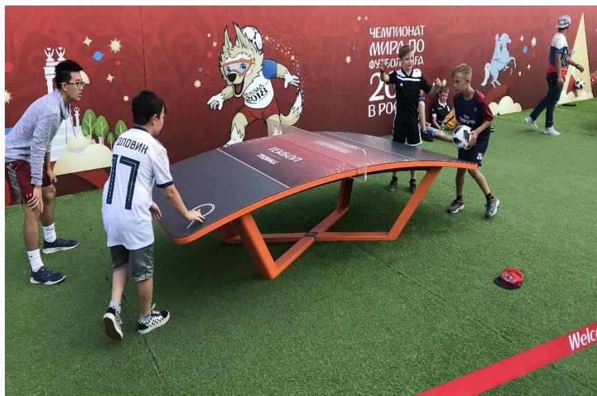
Стол для игры в текбол и текволи