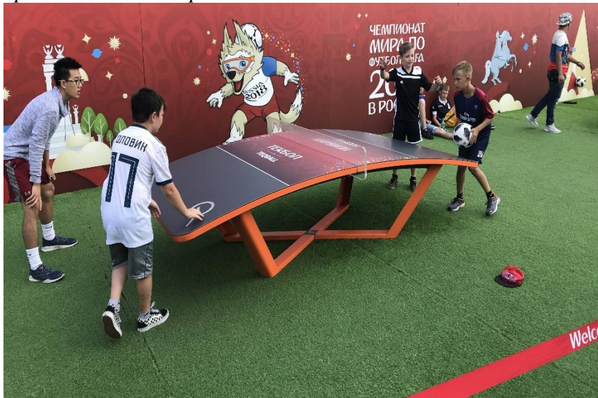
Tables for Teqball and Teqvolley Games