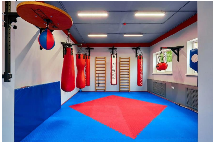
Модернизированный кабинет 306 под единоборства