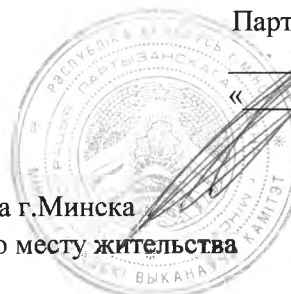
График встреч ИПГ администрации Партизанского района г.Минска с трудовыми коллективами организаций и населением по месту жительства во 2-м квартале 2024 года